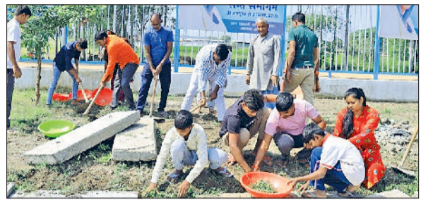
संत निरंकारी मिशन के संत समागम स्थल की सफाई करते हुए श्रद्धालु।

संत निरंकारी मिशन का 78वें वार्षिक संत समागम, पूर्ववर्ती वर्षों की दिव्यता और गरिमा के अनुरूप, इस वर्ष भी 31 अक्टूबर से तीन नवंबर तक समालखा स्थित संत निरंकारी आध्यात्मिक स्थल पर अत्यंत भव्यता, श्रद्धा और आध्यात्मिक उल्लास के साथ आयोजित होने जा रहा है। यह दिव्य आयोजन सतगुरु माता सुदीक्षा महाराज एवं निरंकारी राजपिता रमित के पावन सानिध्य में संपन्न होगा, जिसकी शुभ सूचना ने समस्त श्रद्धालु भक्तों के हृदयों में अपार हर्ष और आध्यात्मिक ऊर्जा का संचार कर दिया है। वहीं, 'आत्ममंथन' विषय पर आधारित इस वर्ष का