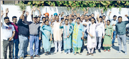
करनाल। मांगों को लेकर प्रदर्शन करते सीपीएलओ कर्मचारी।

मार्च 2024 से पंचायत व सीआरआईडी विभाग में कार्यरत सीपीएलओ अपनी सेवाएं निष्ठा से दे रहे हैं, लेकिन मानदेय व टास्क बेस कमीशन समय पर नहीं मिल पा रहा जिसे लेकर सीपीएलओ में आक्रोश पनप रहा है और आंदोलन को मजबूर