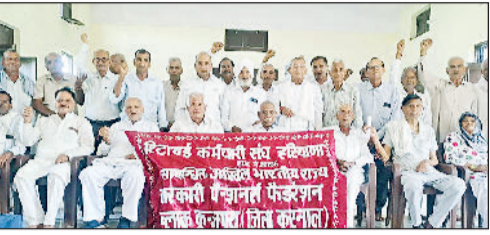
करनाल। मांगों को लेकर प्रदर्शन करते रिटाइड कर्मचारी।