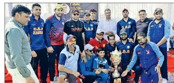
पानीपत। एडवोकेट प्रीमियर लीग में विजेता अतिथियों के साथ प्रसन्न मुद्रा में।