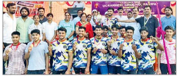
हरियाणा जूनियर रग्बी चैंपियनशिप के विजेता अतिथियों के साथ।