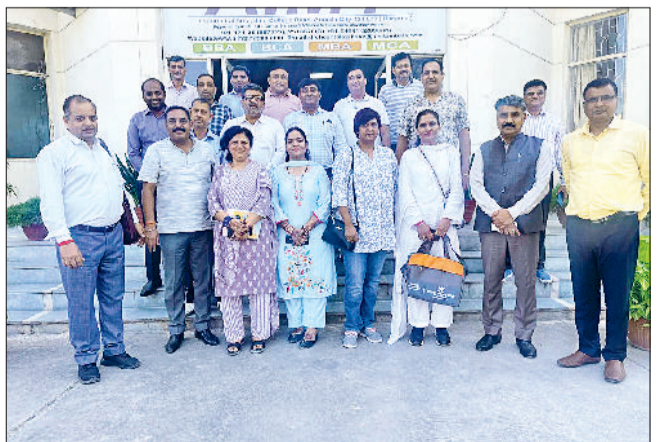
अंबाला। अधिवक्ता परिषद की मीटिंग में मौजूद पदाधिकारी व सदस्य।