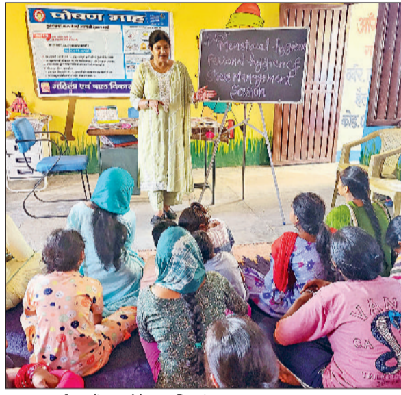
बराड़ा। कार्यक्रम में भाग लेते हुए महिलाएं।