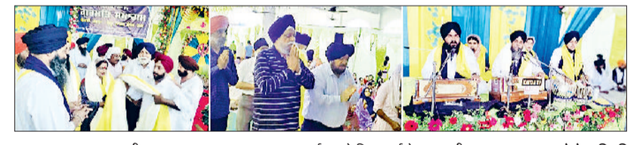
करनाल। गुरु धन धनी गुरु रामदास महाराज का प्रकाश पर्व मनाते सिख धर्म के अनुयायी।

धन धनी गुरु रामदास जी महाराज के प्रकाश पर्व पर दीवान सजा अटूट लंगर बरता हरिभूमि न्यूज करनाल