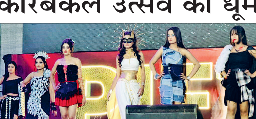
समालखा। पाइंट में कारबंकल उत्सव में फैशन शो में भाग लेती छात्राएं।